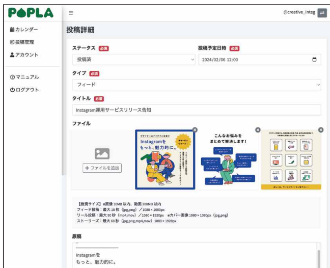
▲ 下書き：原稿の下書きができます

さらに、アカウントの開設から運用ルール作成などの初期設定、投稿の画像やキャプション作成などの投稿サポート、投稿のデータ解析や改善提案などの運用サポートを追加することができ、それらをインテグの経験豊富なデザイナーやクリエイティブディレクターが直接行うのが特徴です。